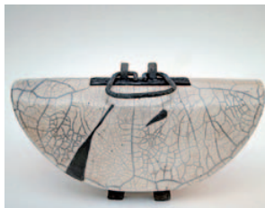
W. Pfeffer-Hutter, Keramik