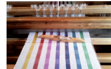
Regina Knoflach, Webstuhl