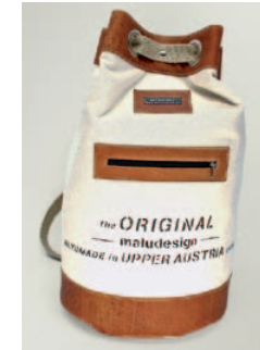
D. Hangweyrer, maludesign,