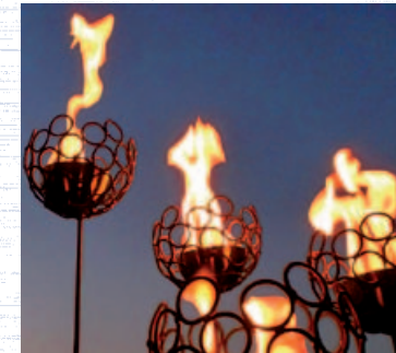
Werner Schweizer, Metallobjekte