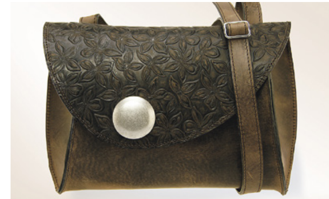
E. Zügel, Deero-Leder