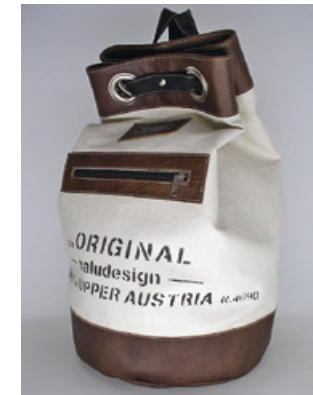
D. Hangweyrer, maludesign