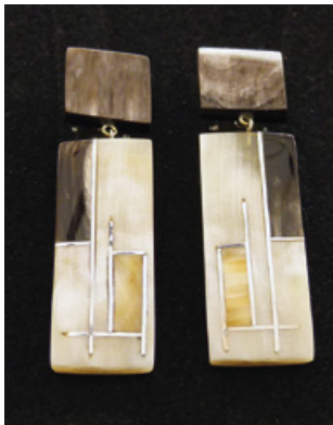
E. Gleisner, Ohrhänger, Horn, Silber