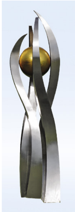
F. Schilcher, Goldkugel