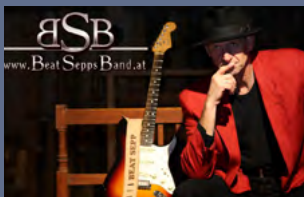
BeatSeppsBand - Trio