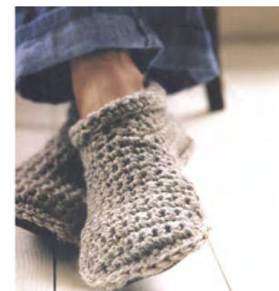
Agnes Winzig, Slipperboots