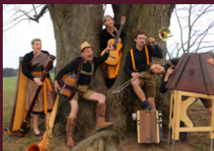
Salzburger Nockerl AUTländisch