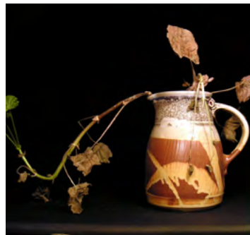
Jutta Szabo, Keramik aus dem W/4

Der Kunsthandwerksmarkt Seeham wird unterstützt von: