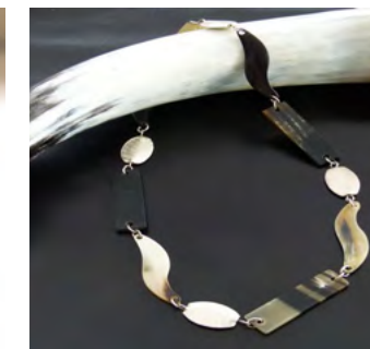
Gleisner, Hornkette mit Silberteilen