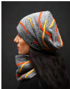
Beatrice Psota, Kopfbedeckung