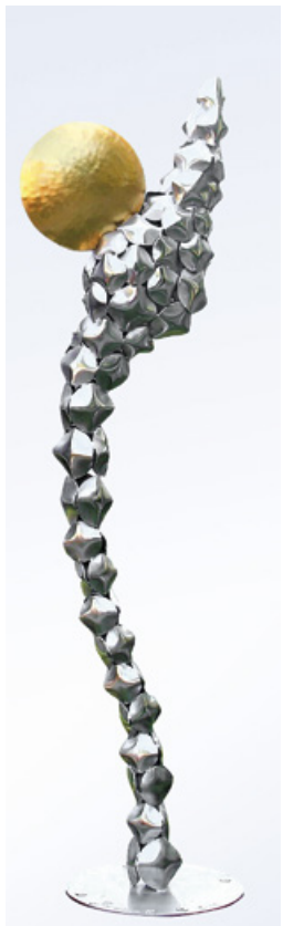
F. Schilcher, Skulpturen