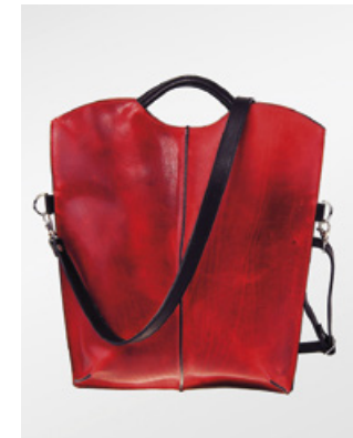
E. Zügel, Deero-Leder