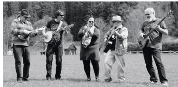
Woody's Folk House