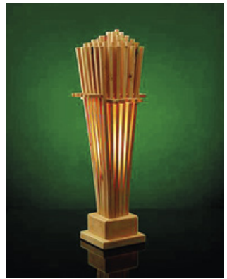
Gerhard Dembski, Zirbenlampe