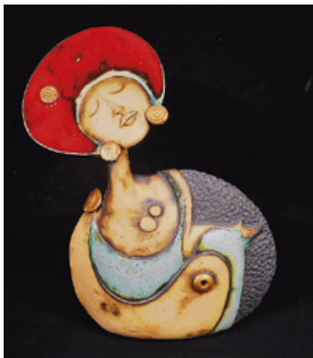
Fabiano Sportelli, Keramik