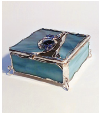
György Wirtz, Schmuckkästchen